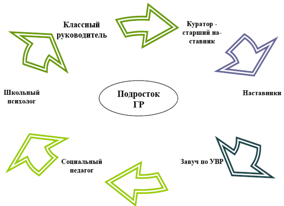
Рис. 3. Схема взаимодействия сопровождения подростка группы риска