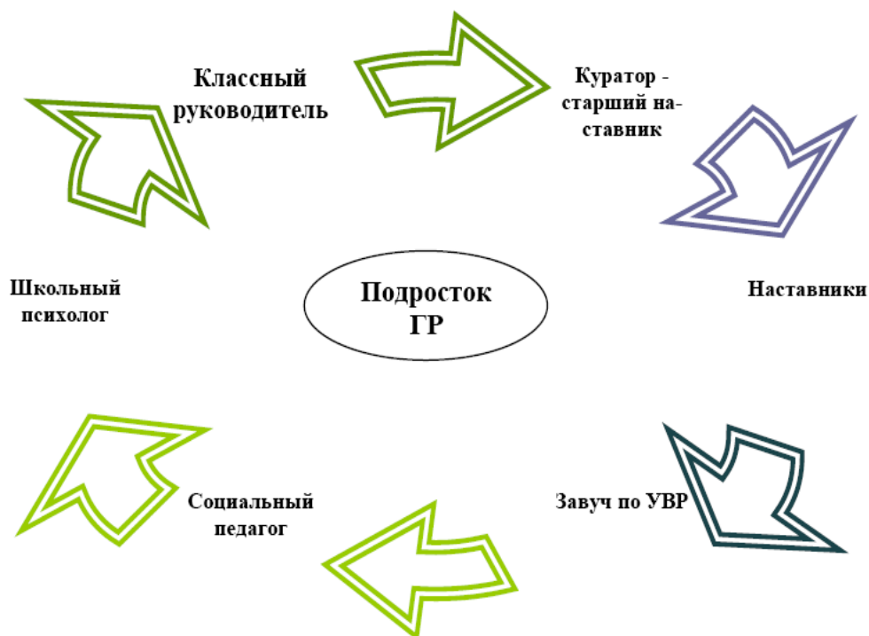
Рис. 3 Схема взаимодействия сопровождения подростка группы риска